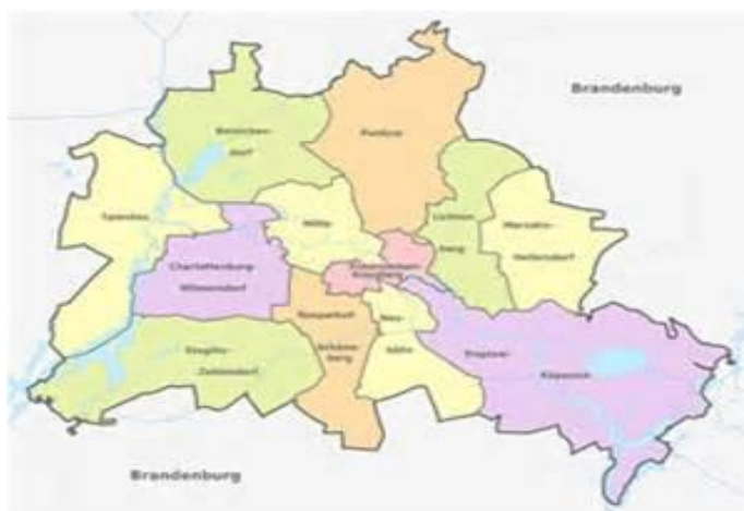
Berlins olika stadsdelar, översiktligt

Efter en god lunch på hotellet samlades vi i hotellobbyn och tog spårvagn och sedan en buss genom Tiergarten till De Nordiska Ambassaderna/Nordische Botschaften. Bussturen med buss 100 är i sig en studieresa då den passerar förbi nästan alla de stora sevärdheterna i Berlins innersta kärna. Vi anlände strax före 16:00 till ambassadbyggnaden som ligger i södra kanten av Tiergarten.