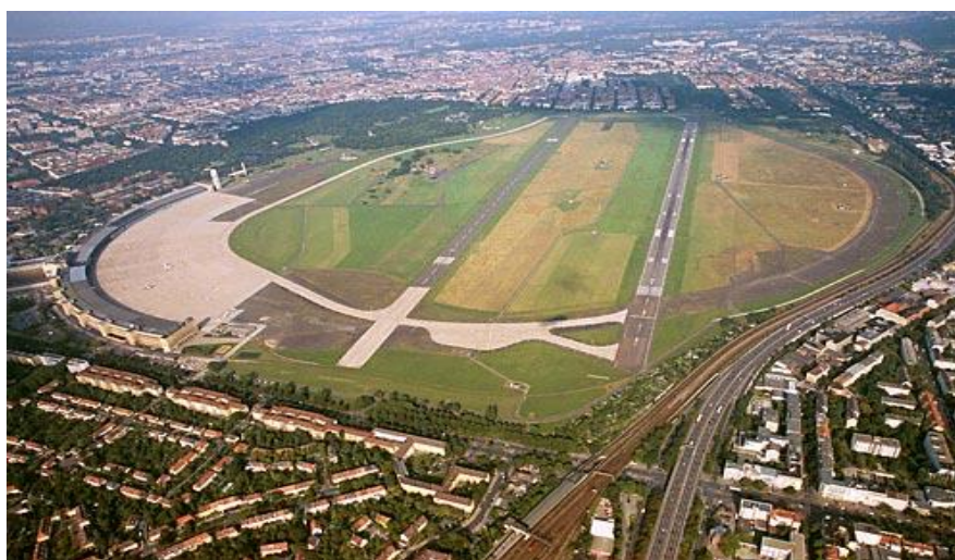
Tempelhof-fältet, flygplatsbyggnaden är nu till vänster i bild