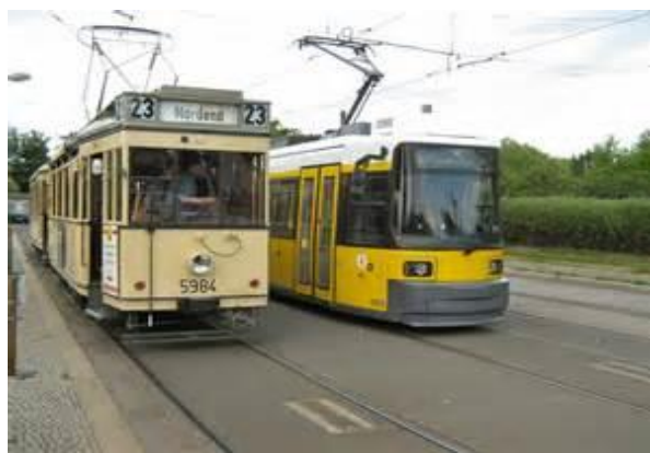
En ny och en lite äldre spårvagn i östra Berlin