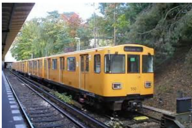
S-Bahn, det gigantiska pendeltågsnätet