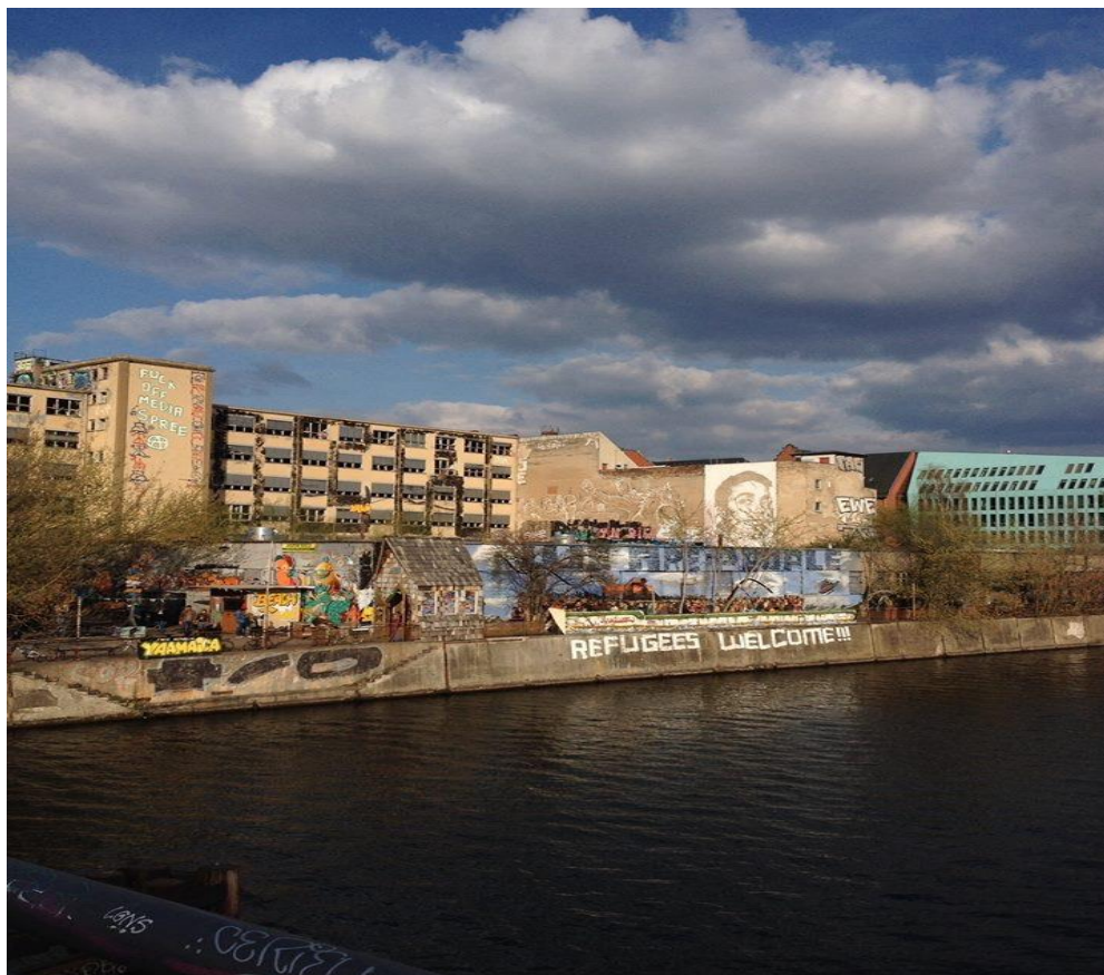
YAAM sett från bron An Der Schillingbrücke