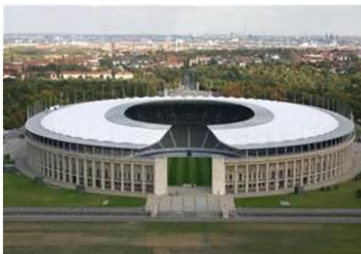
Berlins Olympiastadion som invigdes till OS 1936

Alla barn som går i 3:e klass i Tyskland genomgår ett motoriskt test som pågår i 3-4 timmar. Utifrån testresultatet ges rekommendationer till varje barn.