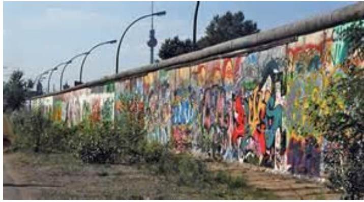
Exempel på graffiti i Berlin