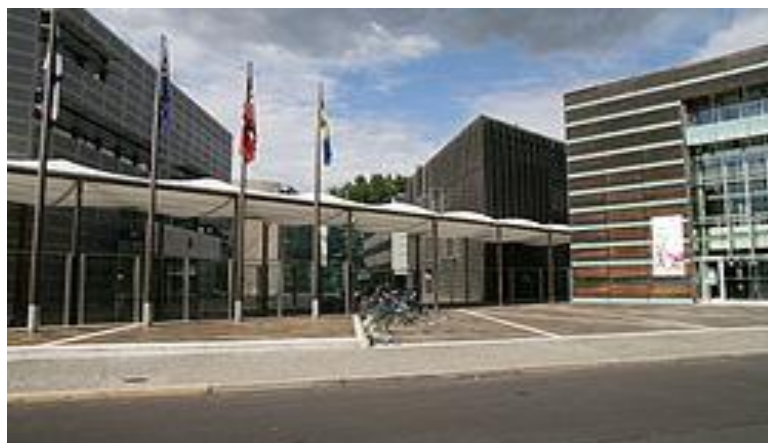
De Nordiska Ambassaderna, den gemensamma gården