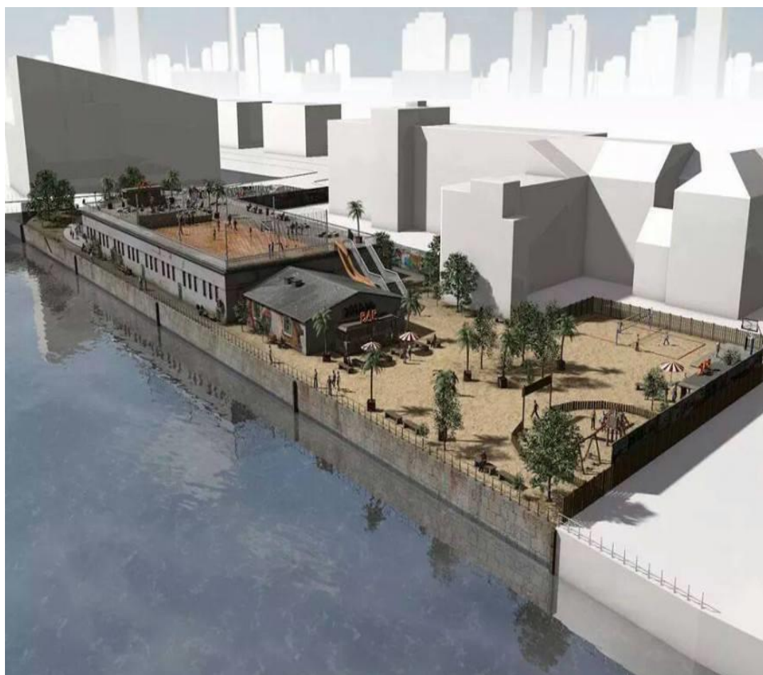
En modellbild av YAAM som stämmer ganska bra med verkligheten.