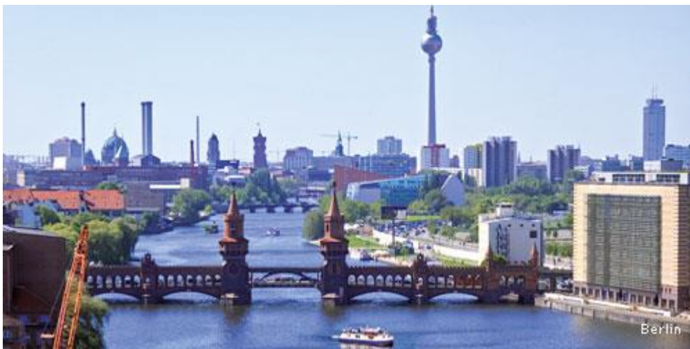
Floden Spree från sydost med Oberbaumbrücke i förgrunden och TV-tornet i Mitte i bakgrunden